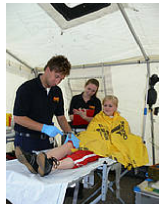
Eine Patientin wird behandelt.

Bedingt durch die hohen Temperaturen hatten die Sanitäter des ASB viel zu tun. Am Kilometer 22 mussten die Samariter 31 mal Hilfe leisten, am Kilometer 40 wurden 37 Patienten behandelt.