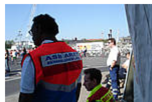
Notarzt und Rettungsdienstpersonal des ASB