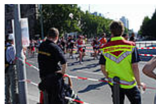
Haben alles im Blick: Sanitäter des ASB